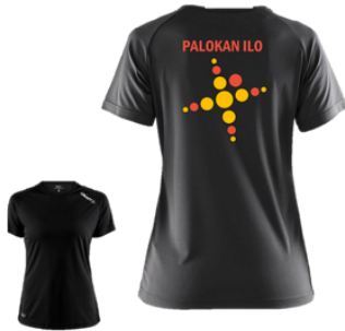
Craft t-paita 25 €