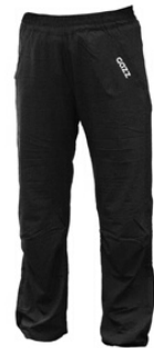
Gazz ohuet kangashousut 40 €