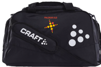
Craft treenikassi 40 €