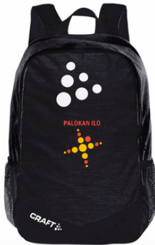
Craft reppu 40 €