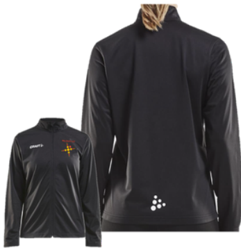
Craft verkkatakki 37 €