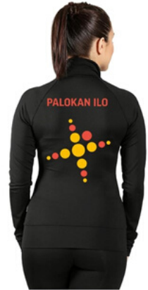
Piruetin treenitakki oranssilla kauluksella (edustustakki) 65 €