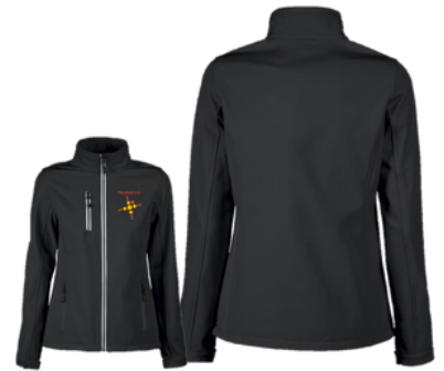
Softsell takki broderauksella 45 €