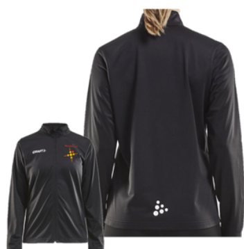
Craft verkkatakki 37 €