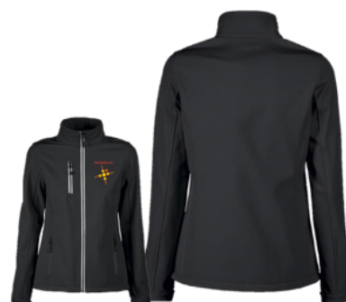
Softsell takki broderauksella 45 €