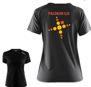
Craft t-paita 25 €