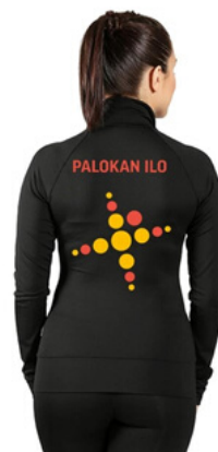
Piruetin treenitakki oranssilla kauluksella (edustustakki) 65 €