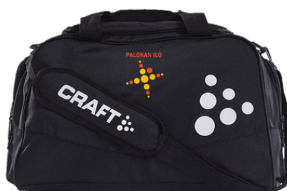
Craft treenikassi 40 €