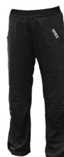
Gazz ohuet kangashousut 40 €