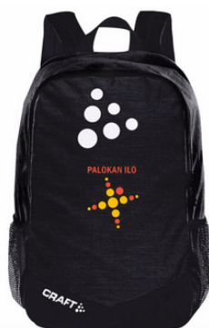
Craft reppu 35 €