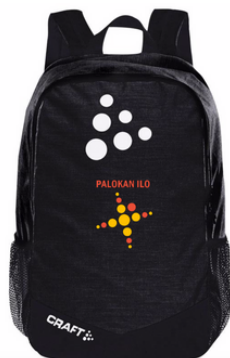
Craft reppu 35 €